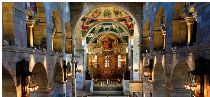
Viborg Domkirke